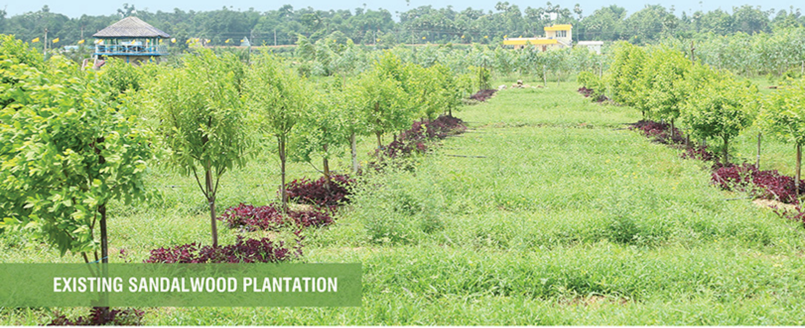
EXISTING SANDALWOOD PLANTATION